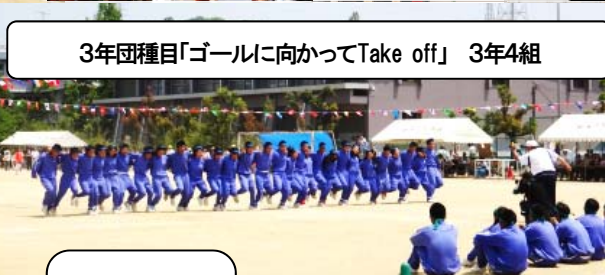
3年団種目「ゴールに向かってTake off」 3年4組