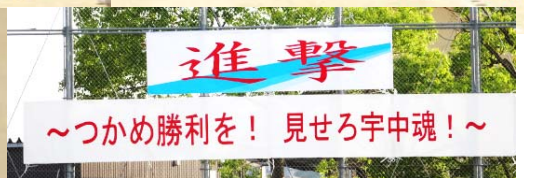
～つかめ勝利を！ 見せろ宇中魂！～